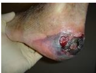
オペ 2 週間後

治癒傾向だったものの、黒い壊死部が現れる。この時点でエキシマーレーザー PTA のできる病院への転院し、血管外科へコンサル。重度虚血下肢との判断で、レーザー PTA で血流再建オペを施行し、創傷部 SPP も 50 まで上昇、後日完治した。