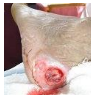
オペ後 3 日目